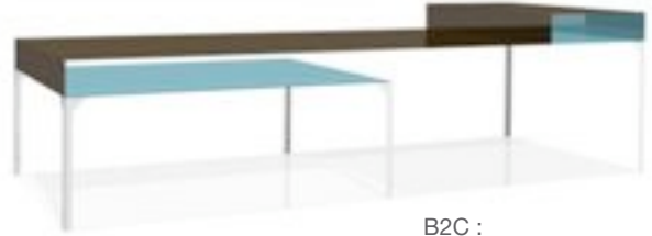
B2C : table basse aluminium thermolaqué L:200 cm l:80 cm h:46 cm

La plupart des objets que je dessine sont liés à une rencontre, un accident, une forme qui me séduit, une tâche sur le bord d'une nappe, un griffonnage sur une feuille. Ils découlent plus d'une impulsion, d'un étonnement, d'un amusement que d'une réflexion.