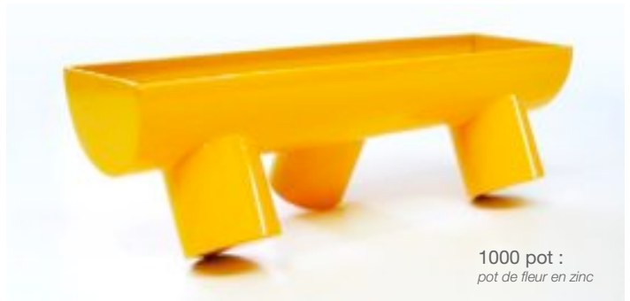
1000 pot : pot de fleur en zinc