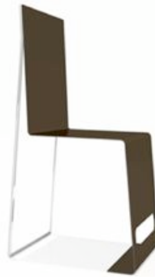
LOOP chaise aluminium thermolaqué h:92 cm l:38 cm p:40 cm