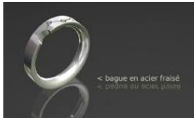
bague : bague en acier fraisé