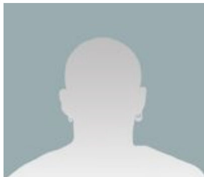
R3 (TRIBUTE TO M. PISTOLETTO) miroir sérigraphié dimensions variables