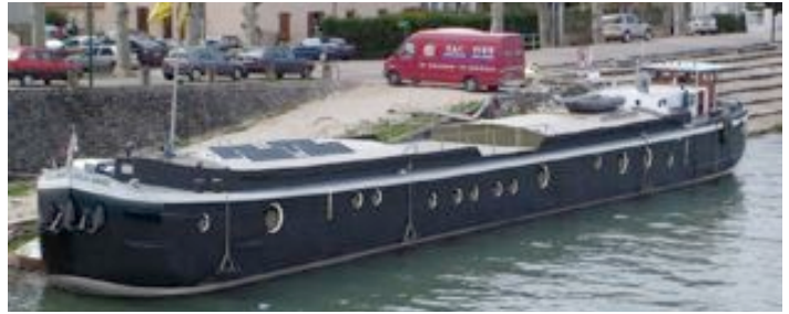
péniche : aménagement d'une péniche en habitation

Iota fonctionne en réseau avec un groupe de graphistes, designers maquettiistes et architectes frontaliers.