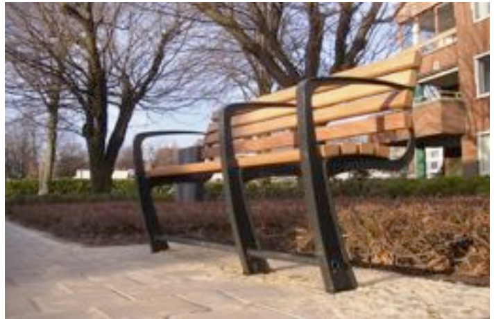
Banc public pour personnes âgées