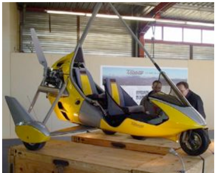
ulm : ulm pendulaire pour Aircréation