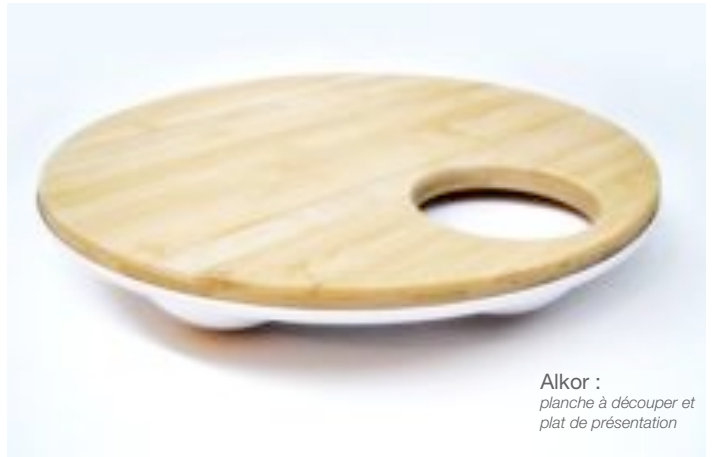
Alkor : planche à découper et plat de présentation