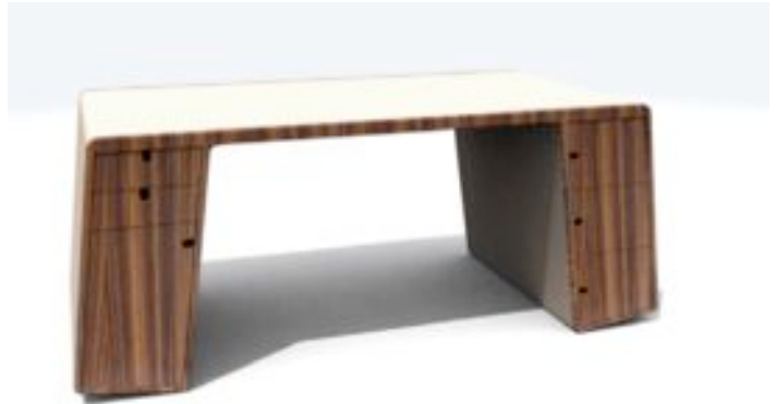
Desk : bureau

Les transformer, les muter au plus simple de manière à ce qu'ils ne répondent plus à leur fonction propre mais à un besoin.»