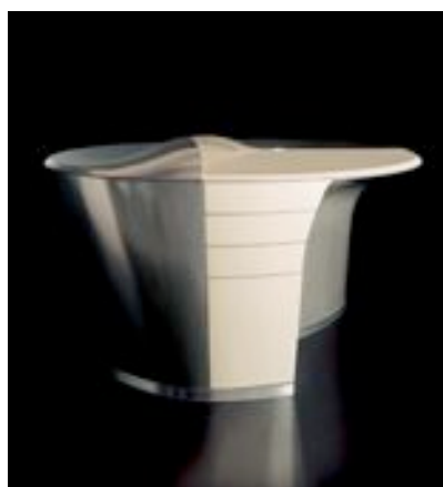
bureau : bureau pour Sakata