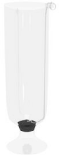
JAMES vase h:40 cm