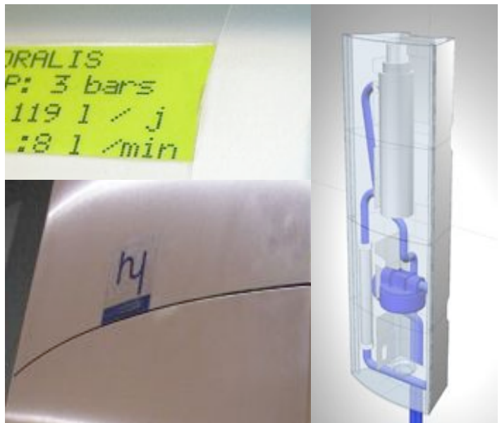
Appareil de filtration à eau avec écran de contrôle radio-piloté. L'appareil se branche directement après le compteur d'eau et vient supprimer les problèmes de calcaire, le goût du chlore, et les bactéries.