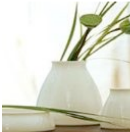
Evidence, vases en céramique émaillée éd. Ligne Roset