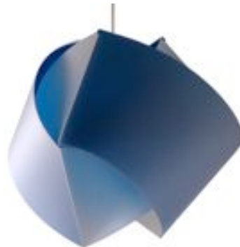
Lampe en polypropylène (suspension ou sur pied) offrant la possibilité de changer sa couleur par un jeu de filtre de couleur.