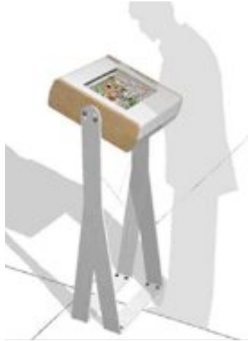
borne multimédia : esquisse de borne multimédia pour Anamnesia