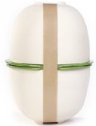
Gellul pots de fleurs en céramique, éd. Kollektion.