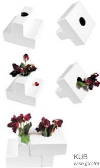
KUB vase (prototype) L:15 cm l:15 cm h:12 cm